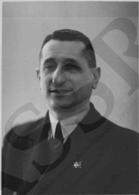
Regio gine Gustavo Gaslini